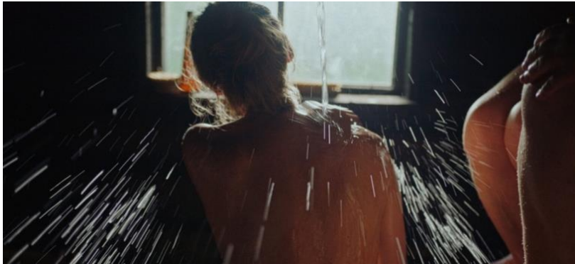
Smoke Sauna Sisterhood

Projection de SMOKE, SAUNA, SISTERHOOD précédée du court métrage inédit SAUNA DAYS